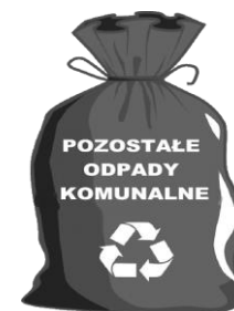
WORKI LUB POJEMNIK ZAPEWNIĄ WŁAŚCICIEL