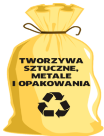
WORKI ZAPEWNIĄ ZM NATURA