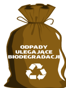
WORKI ZAPEWNIĄ ZM NATURA