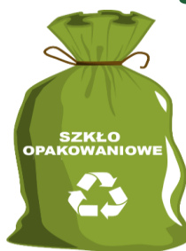
WORKI ZAPEWNIĄ ZM NATURA