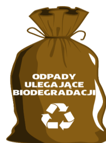
WORKI ZAPEWNIĄ ZM NATURA