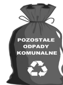
WORKI LUB POJEMNIK ZAPEWNIĄ WŁAŚCICIEL