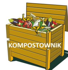
KOMPOSTOWNIK ZAPEWNIĄ WŁAŚCICIEL