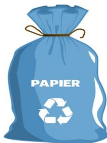
WORKI ZAPEWNIĄ ZM NATURA